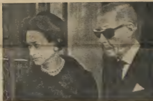
Aki nos ta mira e duque, despues di e operacion na su wou, bati cu bini acur, y e duquesa di Windsor, momento cu nan ta saliendo for di Claridge Hotel pa asisti na entreno di un suan muiher di e duque. Tabata di prome bes cu e duquesa a asisti na un tal ceremonio publico na Inglia terra.

E citacion aki a wordi hasja pa medio di un investigacion COMPLETAMENTE INDEPENDIENTE ariba peticion di "OBSERVADOR" y "NEWS".